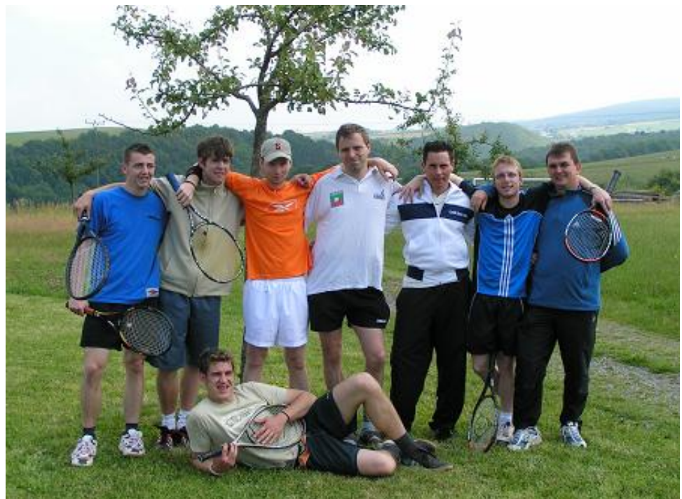
Die siegreiche Herrenmannschaft in Deuselbach

Für die beiden Aufsteiger heißt es nun natürlich erst einmal, die Klasse zu halten. Schließlich weiss man ja nie so genau, wie die neuen Gegner einzuschätzen sind.