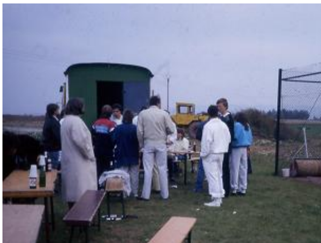
Vereinsmeisterschaften 1988 mit dem legendären Bauwagen als Clubhaus