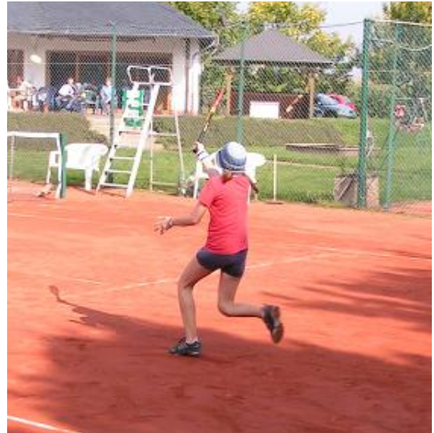
Offensive: Unsere Jugend kämpft sich nach vorne

wir nun zwei neue Jugendwarte, ich denke aber, dass es genauso positiv weiter gehen wird.